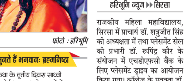
सिरसा। प्लेसमेंट ड्राइव में भाग लेते विद्यार्थी।