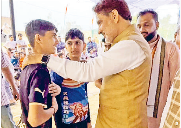
फतेहाबाद। खिलाड़ियों से परिचय प्राप्त करते हुए राज्यसभा सांसद सुभाष बराला।

सांसद ने गांव में स्थापित आधुनिक जिम का भी उद्घाटन किया