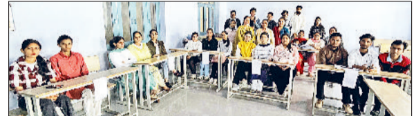
सिरसा। कॉलेज में बजट विषय पर चर्चा करते हुए।

सीएमके स्नातकोत्तर महाविद्यालय में बुधवार को केंद्रीय बजट 2026-27 युवा शक्ति प्रेरित बजट विषय पर एक अंतर-महाविद्यालयीय समूह चर्चा का आयोजन किया। चर्चा के दौरान प्रतिभागियों ने शिक्षा, कौशल विकास, स्टार्टअप प्रोत्साहन, रोजगार सृजन, डिजिटल अर्थव्यवस्था तथा युवा सशक्तिकरण जैसे विषयों पर अपने विचार प्रस्तुत किए। विद्यार्थियों ने विशेष रूप से बजट में