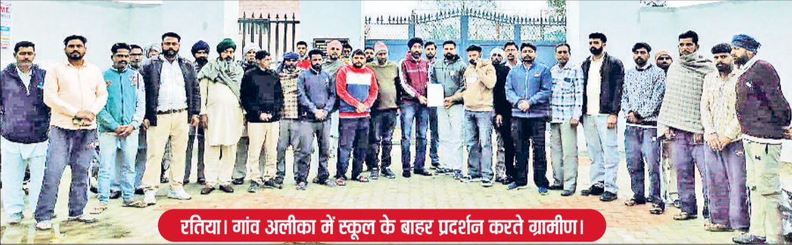
रतिया। गांव अलीका में स्कूल के बाहर प्रदर्शन करते ग्रामीण।

■ गांव अलीका में राजकीय विद्यालय के 5 अध्यापकों का तबादला किया