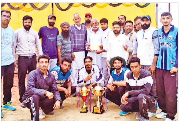
सिरसा। ट्रॉफी के साथ टूर्नामेंट की विजेता टीम।