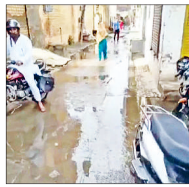
फतेहाबाद। ठाकर बस्ती में गलियों में फैला सीवरज का गंदा पानी।

स्थानीय निवासियों के अनुसार सीवरज व्यवस्था ठप होने से महिलाओं, बच्चों और