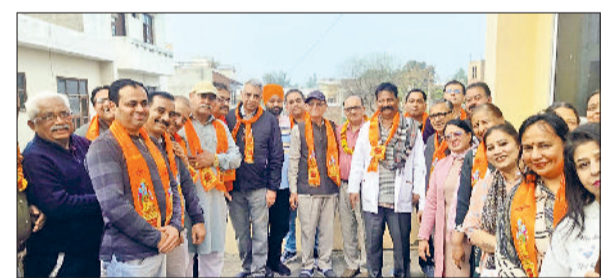
फतेहाबाद। मेडिकल प्रकोष्ठ के नवनिर्वाचित पदाधिकारियों को बधाई देते ऑल इंडिया अरोड़ा खत्री पंजाबी कम्युनिटी के सदस्य।