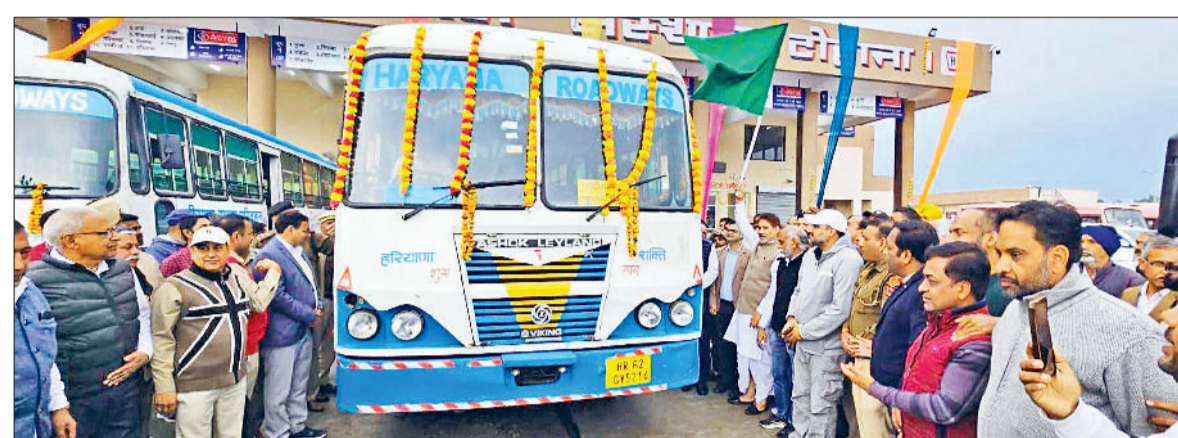
टोहाना। नए बस स्टैंड से बस को रवाना करते सांसद सुभाष बराला।