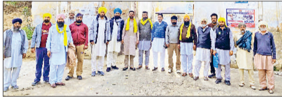
रतिया। शहर थाने की बाहर विरोध जताते हुए किसान संगठन के सदस्य।