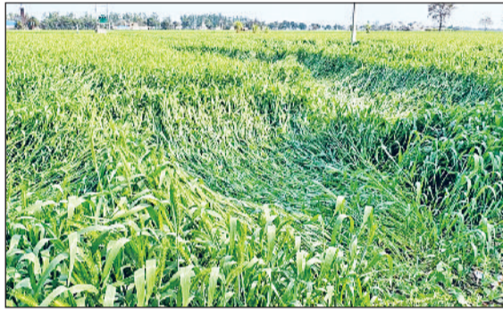
फतेहाबाद। बरसात से खेतों में बिछी फसल।

में तापमान में बेतहाशा वृद्धि हुई थी जिससे गेहूं उत्पादक किसान व कृषि विशेषज्ञ चिंतित थे। पहले 6 फरवरी, फिर 9 फरवरी को पश्चिमी विक्षोभ निर्भर होने के बाद किसानों की आशा 17 फरवरी के मौसम पर टिकी थी। मंगलवार देर रात को रूक-रूक हुई बारिश के बाद बुधवार सुबह भी यहां बादल छाये रहे, जिससे मौसम तो ठंडा