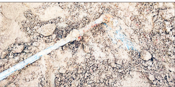
सिरसा। ठेकेदार द्वारा निम्न स्तर की डाली गई पाइप।

खतरा बना हुआ है। इसके अलावा, पाइप लाइन बिछाने में तकनीकी मानकों की पूरी तरह से अनदेखी की गई है। शिकायतकर्ताओं ने बताया कि पाइप लाइन और घरों में किए गए कनेक्शनों में इस्तेमाल की गई सामग्री (पाइप, फेरुल आदि) अत्यंत घटिया स्तर की है। आलम यह है कि अभी गांव में पानी की